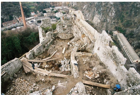
Pogled na arheološki iskop u stambenom dijelu kaštela