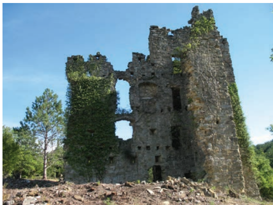
Possert 2007. g.