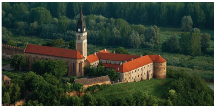
Pogled na kompleks Franjevačkog samostana sa jugoistoka, 2011. g.

No, postoje i čvrste indicije o starijim slojevima grada - neke koje smo poznavali, ali i neke do kojih smo došli terenskim istraživanjima.