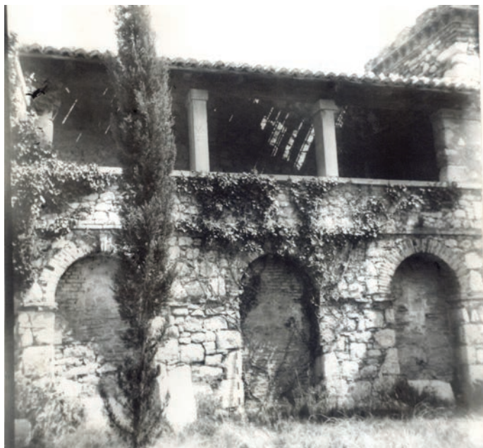
Grobnice u kaštelu

Naime, budući da još od posljednje velike intervencije Trsat služi prvenstveno za smještaj ugostiteljske ponude te povremeno za smještaj suvenirnice, očito je da njegove glavne značajke još nisu zapravo prepoznate, pa onda niti valorizirane ni prezentirane na pravi način.