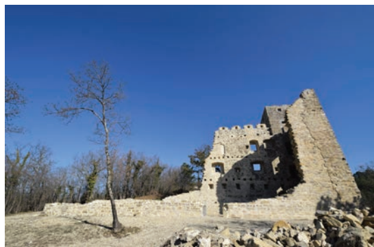
Possert 2014. g.

istom su periodu obavljani i obimni konzervatorsko-restauratorski radovi kojima je utvrda cjelovito konzervirana i spašena od daljnjeg propadanja.