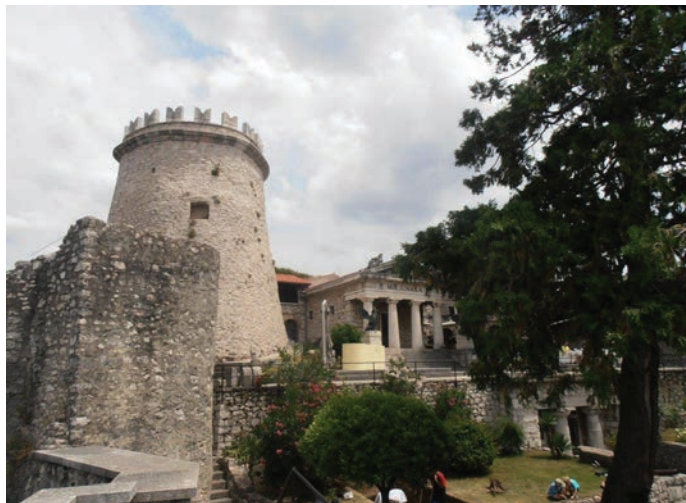
Pogled na dvorište kaštela

Trsatska Gradina je svakom putniku i turistu nezaobilazna točka u obilasku grada Rijeke. Osim dojmljivog panoramskog pogleda što nam nude obnovljene, rekonstruirane, pregrađene ili potpuno izmišljene konstrukcije i zidine, one mogu poput dobre kazališne scenografije biti načinjene i od obojanih gips-kartonskih ploča. Kazališna scenografija na rubu kamenitog brijega. Trsat nije bio nikada dvorcem, stanom nekog imućnog feudalca, nema raskoši kao ni traga obrtnički ili barem malo stilski i umjetnički prepoznatljivom komadu kamena. To je vojnički skromna utvrda, koja je poput mnogih naših kaštela ostala bez funkcije već polovicom 17. stoljeća, da bi je već derutnu uništio veliki potres 1750. godine. Gotovo stoljeće