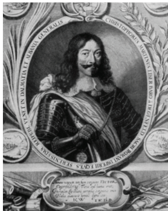
Portret baruna Christopha Martina von Degenfelda

tih prikaza danas moguće identificirati faze izgradnje i različite fortifikacijske elemente na samoj tvrđavi. Štoviše, mogli bismo kazati da je znanstveno proučavanje fortifikacijske arhitekture bez cjelovitog poznavanja Coronellijevog opusa nemoguće.