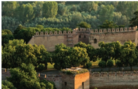
desno: Pogled iz zraka na veliki bastion na jugozapadnom dijelu dodatnog obrambenog prstena s kraja XV. i početka XVI. stoljeća. Istočno od bastiona se nalaze kaskade koje pripadaju sklopu uređenja južne padine perivoja i oranžerije obitelji Odescalchi u XIX. stoljeću; 2011. g.