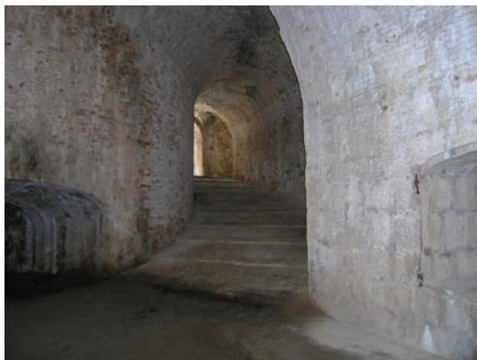
Unutrašnjost Tvrđave Sv. Nikole

Minerska na suprotnoj strani uvala od tvrđave i njenog jedinog ulaza, pojavila se mogućnost obnove tvrđave bez unošenja novih radikalnih sadržaja. Tvrđava bi se, oslanjanjem na infrastrukturu šetnice i informativno propagandnog punkta s kojeg bi se mogla organizirati posjeta, može koristiti u izvornom obliku kao spomenik kulture. Sve potrebe posjetilaca tvrđave mogu se realizirati u objektima u uvali Minerska i na obližnjem otočiću Školjić. Na Školjiću koji je u neposrednoj blizini tvrđave i gdje postoje ruševni objekti mogu se organizirati sve infrastrukturne potrebe. S otočića je i pristup tvrđavi s kopnene strane drvenom pasarelom uz istočnu kortinu tvrđave koja je u povijesti postojala.