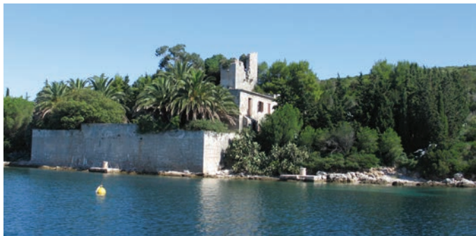
Utvrda na otočiću Sv. Petra pokraj Ilovika

Kakav je naš odnos prema ovom šire prepoznatljivom dijelu identiteta naše regije? Kakvo je stanje očuvanosti, dokumentiranosti i istraženosti spomenika fortifikacijske arhitekture? Postoji li temeljna klasifikacija? Kakve su nam realizacije i planovi konzervacije, valorizacije i prezentacije? Jesu li prepoznate i koordinirane lokalne inicijative? Nadopunjuju li se ili ponavljaju pojedinačni prezentacijski koncepti i izložbeni postavi? Na koje se spomenike i na kakav način valja usredotočiti? Postoji li strategija?