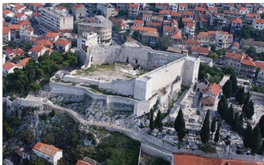
Pogled na šibensku tvrđavu sv. Mihovila prije rekonstrukcije i restauratorskog zahvata