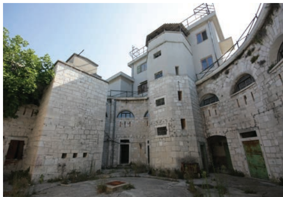
Utvrda Muzil, dvorije

Lošinju. Promjene u konceptu obrane luke i tipologiji fortifikacijskih građevina, te promjene u načinu gradnje i primjeni materijala slijedi napredak u razvoju ratnih strategija i tehnologiji naoružanja i eksploziva. Obrambeni sustav koji se razvija do Prvog svjetskog rata zacementirao je daljnji