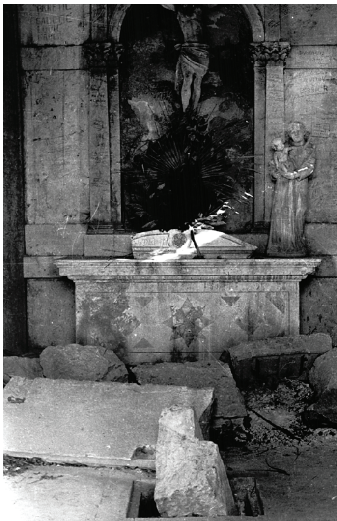
Oltar u kapeli sv. Josipa

Sve ove okolnosti navele su konzervatore da se sustavno pozabave ovim objektom i načine konzervatorski elaborat koji bi postao podloga za njegovu ispravnu konzervatorsku valorizaciju i temelj za buduća postupanja.