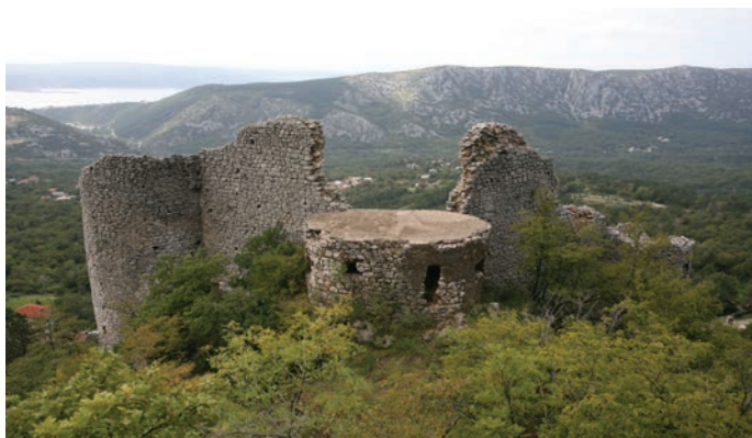
Kaštel Grižane

Kakav je naš odnos prema ovom šire prepoznatljivom dijelu identiteta naše regije? Kakvo je stanje očuvanosti, dokumentiranosti i istraženosti spomenika fortifikacijske arhitekture? Postoji li temeljna klasifikacija? Kakve su nam realizacije i planovi konzervacije, valorizacije i prezentacije? Jesu li prepoznate i koordinirane lokalne inicijative? Nadopunjuju li se ili ponavljaju pojedinačni prezentacijski koncepti i izložbeni postavi? Na koje se spomenike i na kakav način valja usredotočiti? Postoji li strategija?